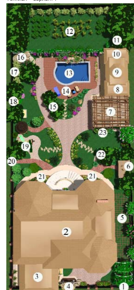
Генплан – вариант 1

Месторасположение: г.Одесса Площадь: 9 соток Особенности местности: участок ровный, правильной формы